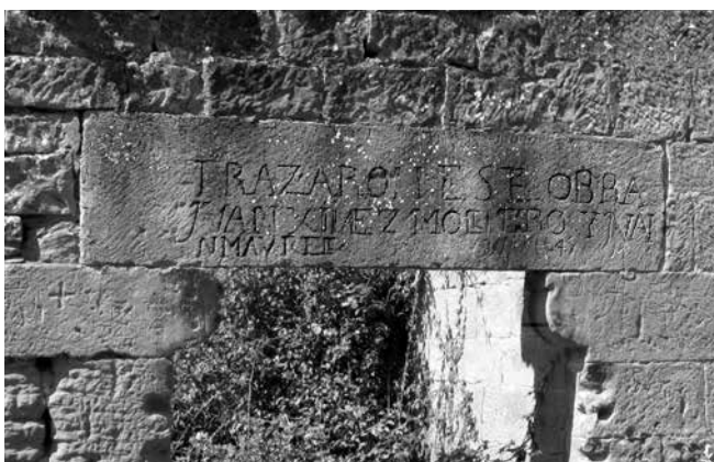
Dintel de la entrada del molino

grandes partes del techo se han derrumbado. En las fotos de 1973, está claro que el techo ha desaparecido por completo. Hay algunos árboles altos en el borde del embalse y a lo largo de la zanja de drenaje, sin embargo, el interior del embalse y de los edificios anteriores todavía están completamente libres de vegetación. En el