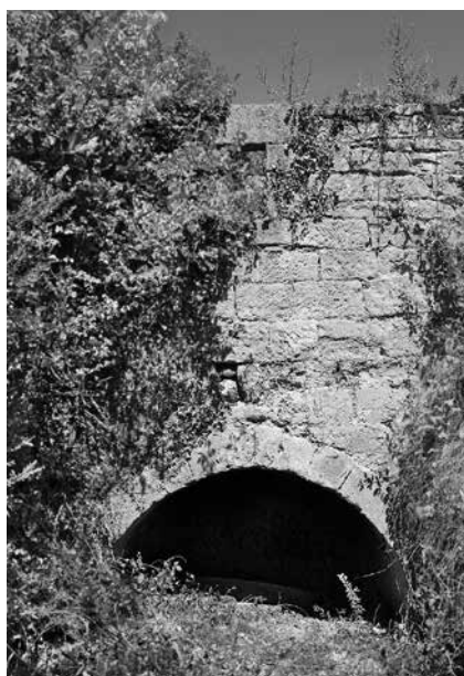
Cárcavo con ventana por encima

Desde la acción de limpieza, el taller había estado completamente ocupado por la maleza, pero con algo de esfuerzo podríamos entrar. Sobre el cárcavo aún pudimos ver el par de piedras. La volandera ha sido sacada de su