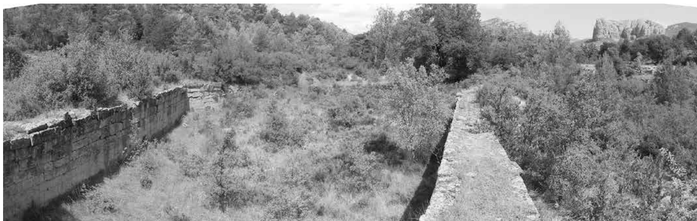
Embalse con los Mallos de Agüero en el fondo

En total, el estanque tiene casi 50 m de largo y hasta 20 m de ancho. Si asumimos una profundidad de agua de 3 m, este estanque contendría aproximadamente 2000 metros cúbicos (2 millones de litros) de agua. Nos gustaría saber si los dos pequeños cursos de agua cerca del molino han logrado llenar ese depósito por completo, en alguna ocasión.