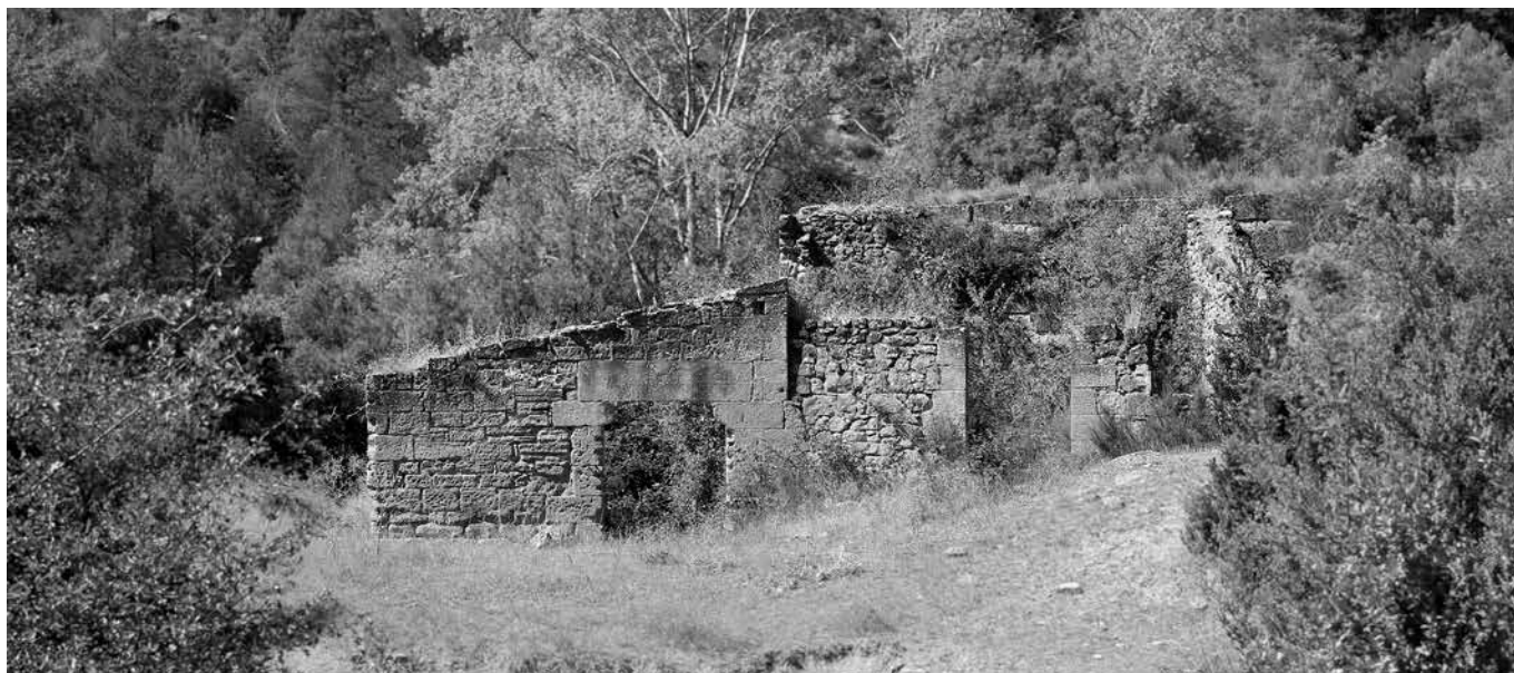
Fachada; a la izquierda el molino; a la derecha una segunda habitación con la pared alta del embalse, detrás