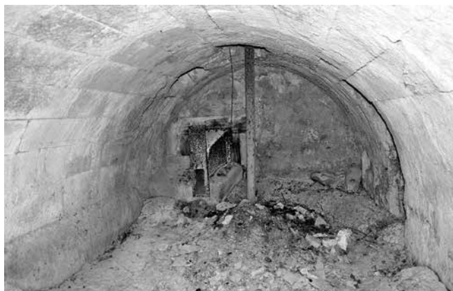
Cárcavo con botana y tajadera