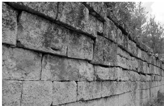
Muro occidental del embalse; interior