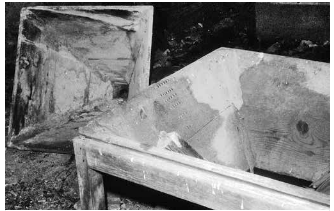
Tolva con filas de clavos — 1995

molinos, de los cuales unos 70 están en Sobrarbe.