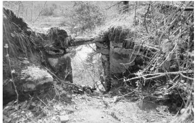
Drenaje del canal al río