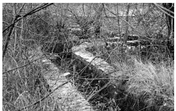
Últimos giros al molino