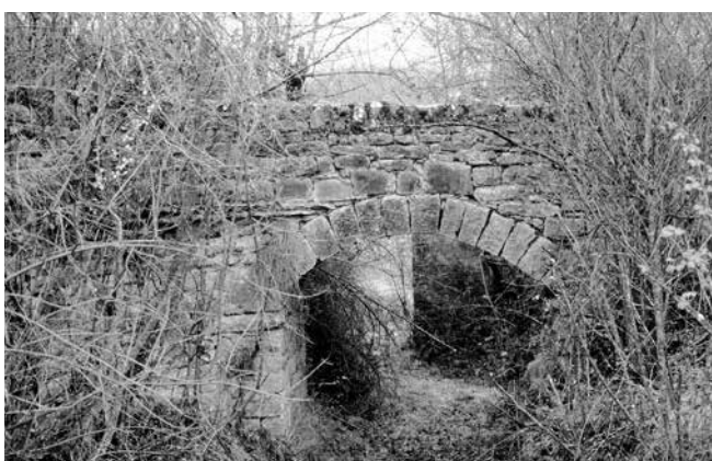
Acueducto por encima del camino al molino

El inicio del canal está bordeado por grandes piedras y a los pocos metros se sumerge en un