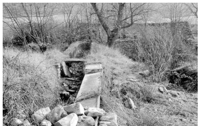
Lavadero, destruido hace muchos años