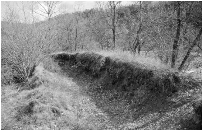
Canal justo al lado del río Ara