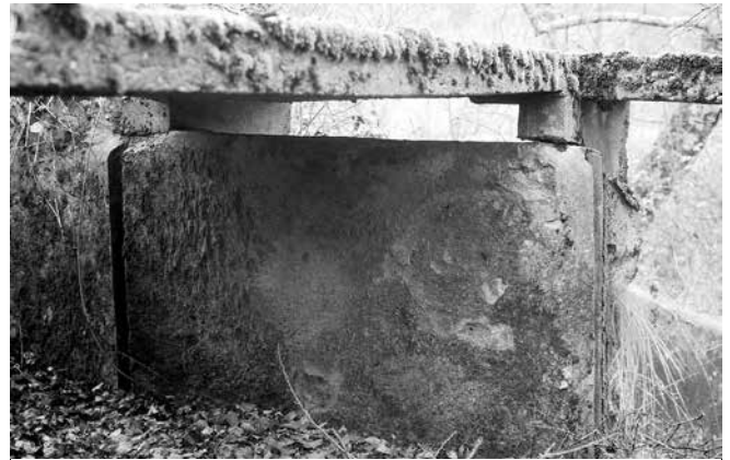
Piedras con rayas para puertas