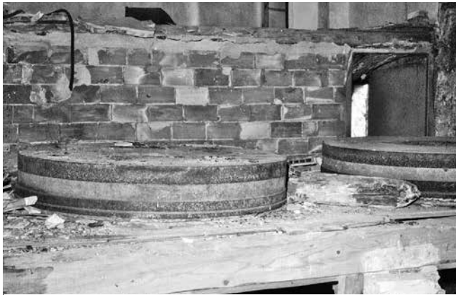
Bancada con dos parejas de piedras de moler — 1989