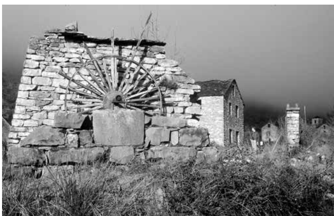
Noria de Lacort

del COLECTIVO “PIRINEOS” † visitamos nuestro primer molino en 1989, en un frío día de diciembre, bajo un cielo muy gris. Desde entonces, hemos visto más de 200