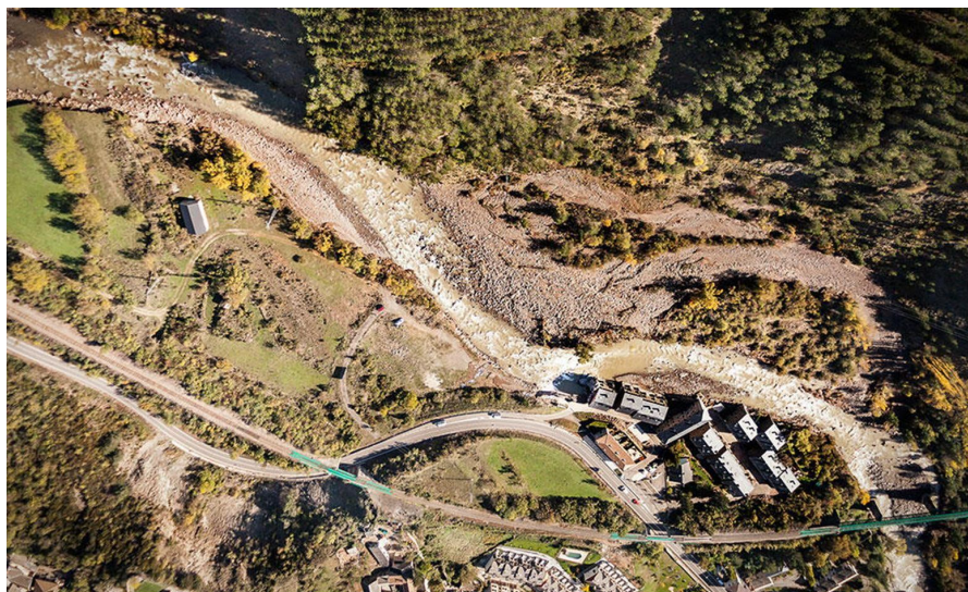
Fotografía aérea tomada después del acontecimiento.

“La Directiva Europea de Inundaciones de 2007 declara que hay que respetar las zonas inundables de los ríos, no introduciendo en ellas edificaciones ni actuaciones. También señala que la solución frente a inundaciones no consiste en aumentar la regulación ni en construir defensas, sino en una ordenación del territorio adecuada y restrictiva que trate de reducir progresivamente los bienes expuestos.”