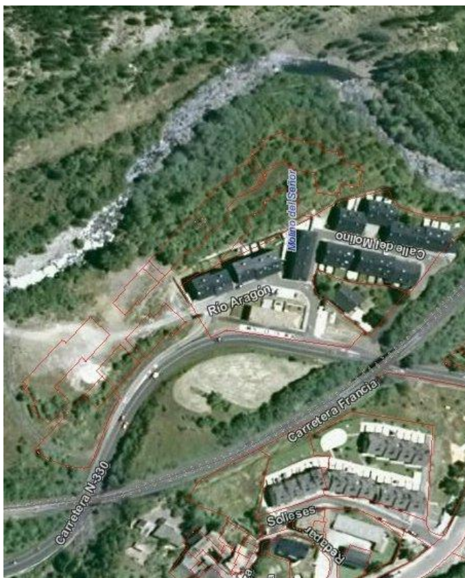
Las líneas rojas indican las edificaciones previstas.

“La Directiva Europea de Inundaciones de 2007 declara que hay que respetar las zonas inundables de los ríos, no introduciendo en ellas edificaciones ni actuaciones. También señala que la solución frente a inundaciones no consiste en aumentar la regulación ni en construir defensas, sino en una ordenación del territorio adecuada y restrictiva que trate de reducir progresivamente los bienes expuestos.”